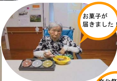
お菓子が 届きました!