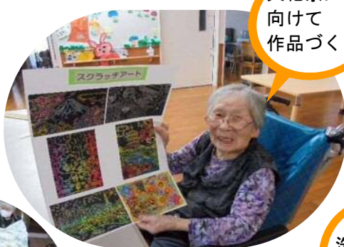
文化祭に 向けて 作品づくり