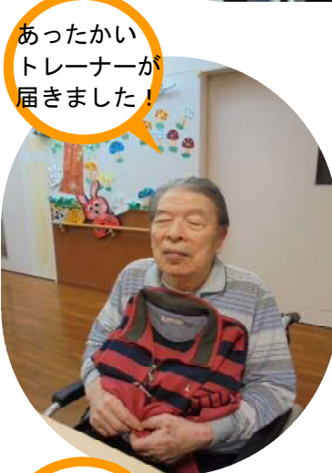
あったかい トレーナーが 届きました!