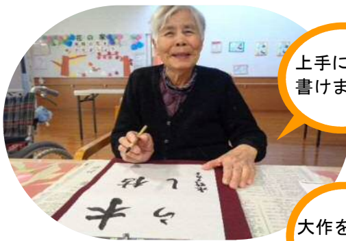
上手に 書けました