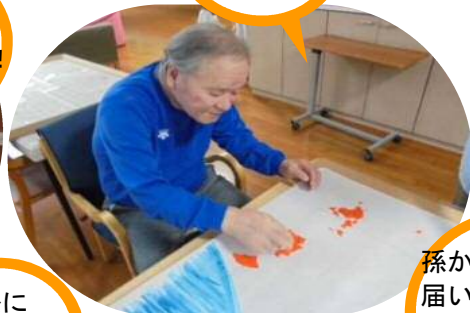
大作を つくってます