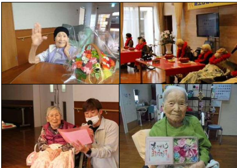
お母さんありがとう～母の日・5月の誕生会～ 久しぶりに大勢でお祝いできました！