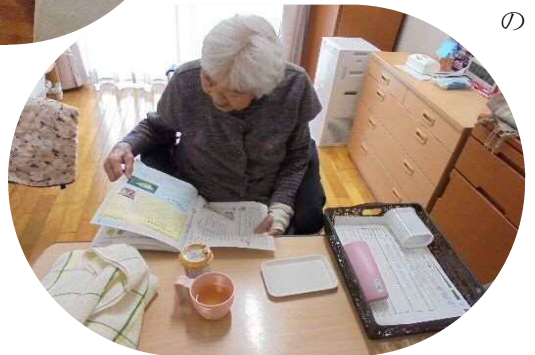
広報誌を チェック