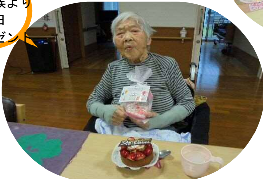
ご家族より 誕生日 プレゼント