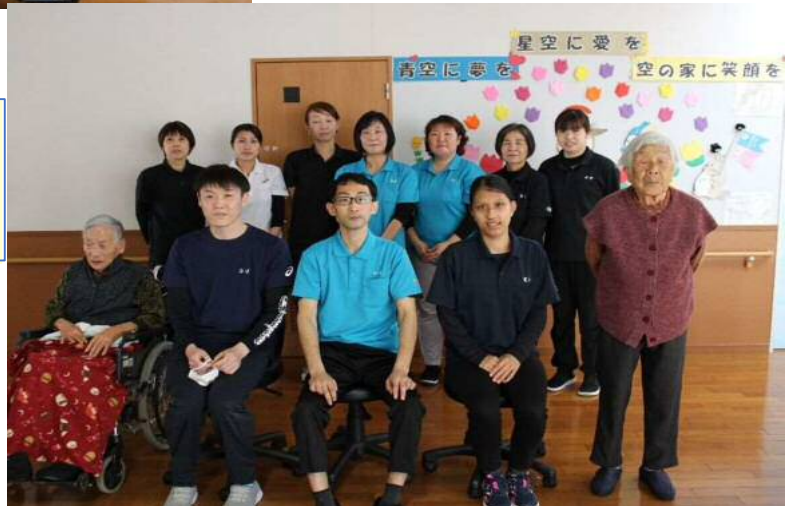
空の家 青空に夢を 星空に愛を 空の家に笑顔を