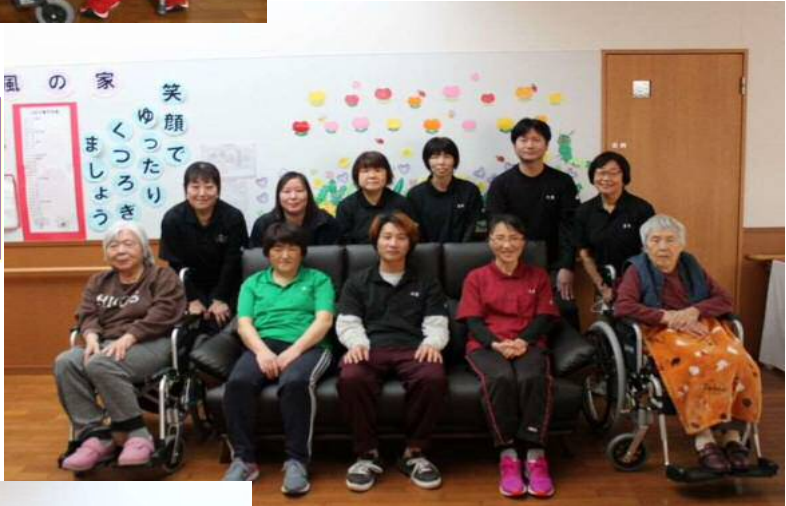
風の家 笑顔でゆったりくつろぎましょう