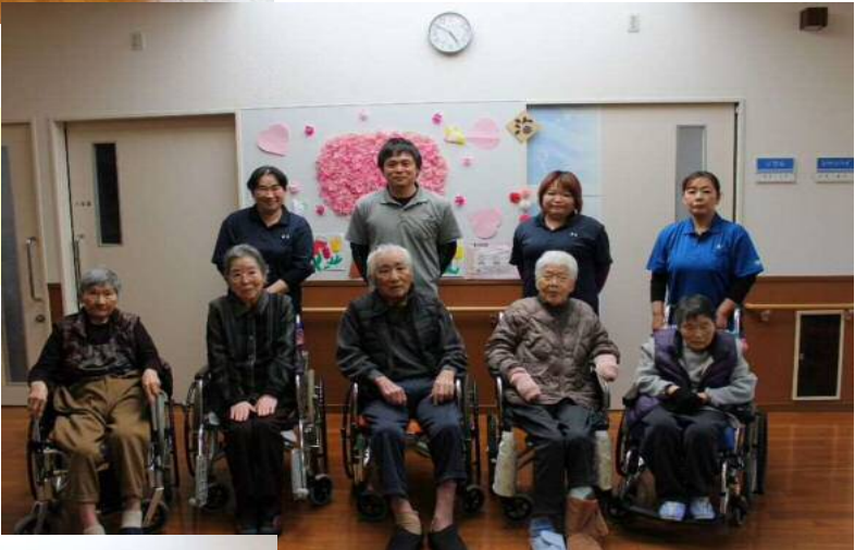
海の家 笑顔あふれる海の家