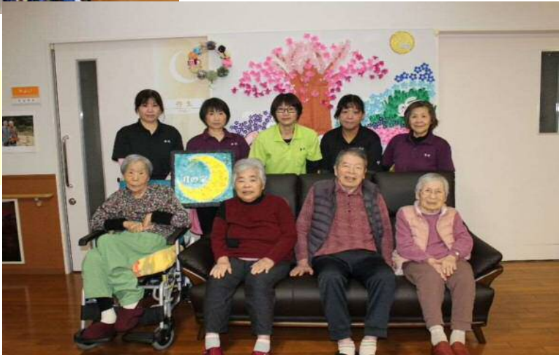
月の家 まあるい心と心のお・つ・き・あ・い