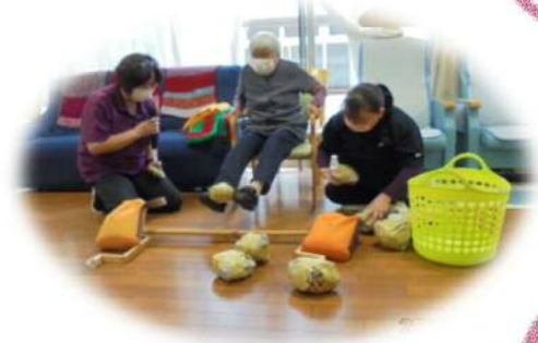
足で引っ越し♪ 上手に運べるかなあ