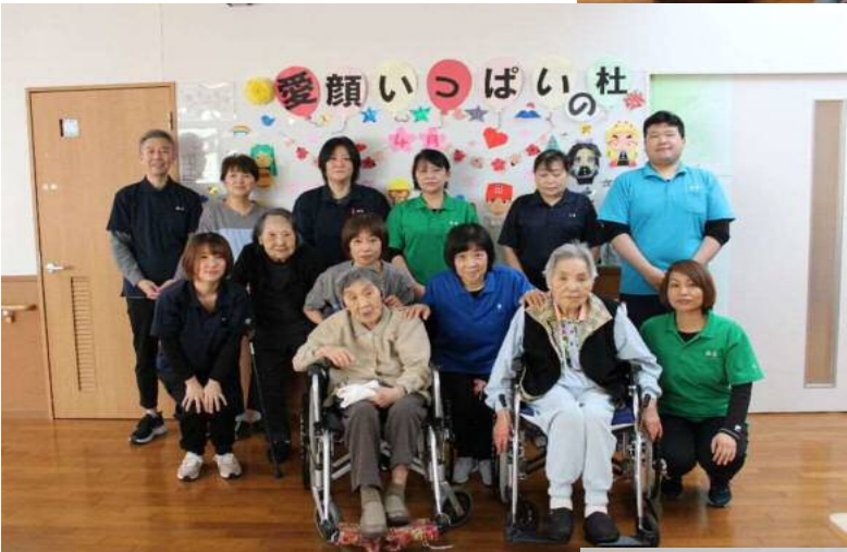
杜の家 笑顔がいっぱい杜の家