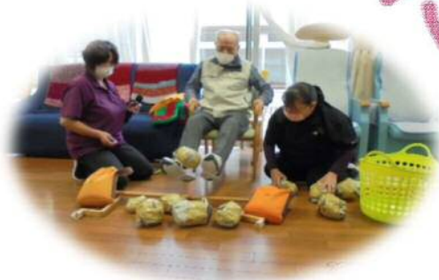
なかなか難しいな!