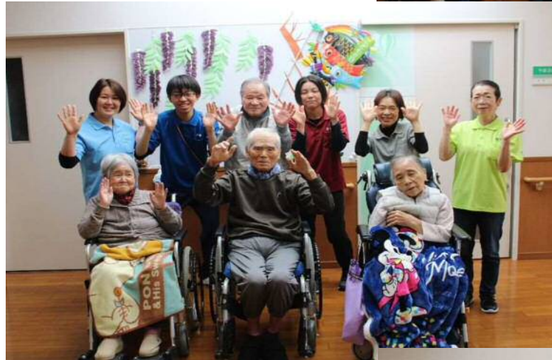
虹の家 七色に笑顔輝く虹の家