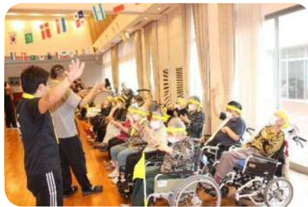
ミュージックケア