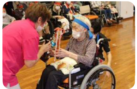
結果発表・表彰式