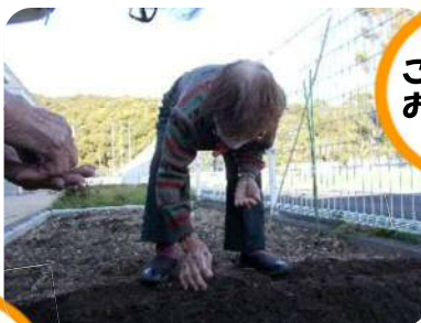
ご家族から お土産