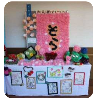
空の家 ピンクのそら賞