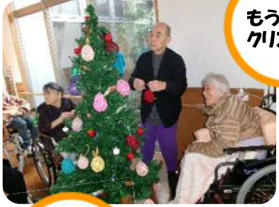
もうすぐ クリスマス