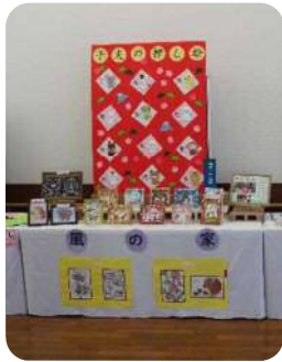
風の家 風の十二支賞