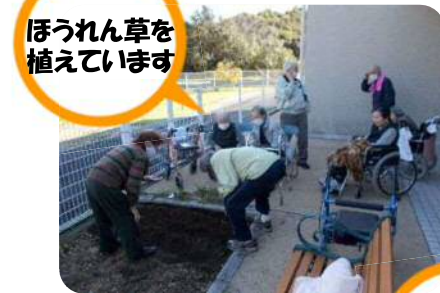
ほうれん草を 植えています