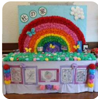
杜の家 七色の花畑賞