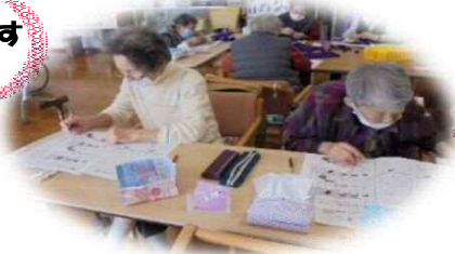
脳トレの問題をがんばっています。😊