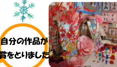
自分の作品が賞をとりました