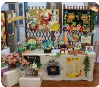
夢・海の家 鶴の羽ばたき賞 幸せを呼ぶシーサー賞