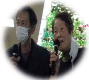
テュエットデーす (・ω・。)/♡