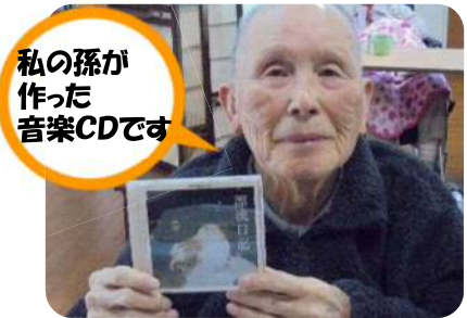
私の孫が 作った 音楽CDです