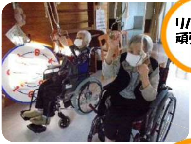
リハビリ 頑張るぞ!