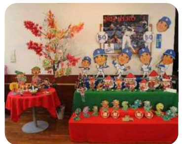
事務所 大谷翔平HERO賞