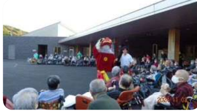
はじめてのポッチャ大会