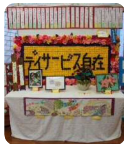
デイ自在 花のウェルカムボード賞