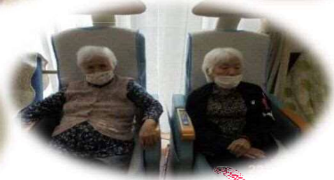
ヘルストロンで血流促進です!(M)!