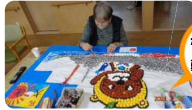
なかなか難しいな～