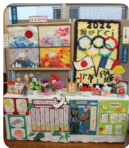
虹・月の家 富士の四季賞 パリ五輪メルシー賞