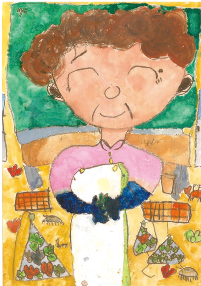
おしごとがんばるおばあちゃん