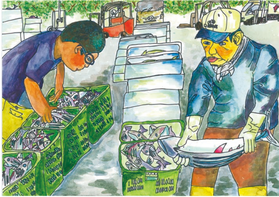
市場で働くおじいちゃん