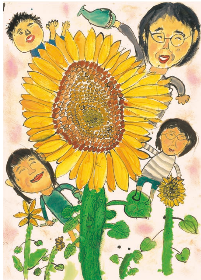
おばあちゃんのひまわり