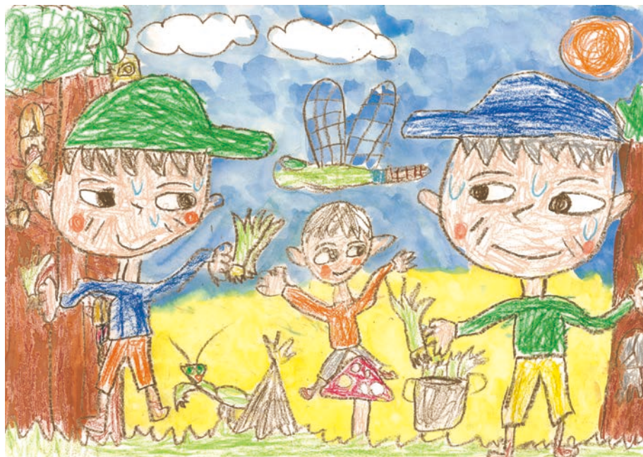
じいちゃんといっしょに草とりしたよ