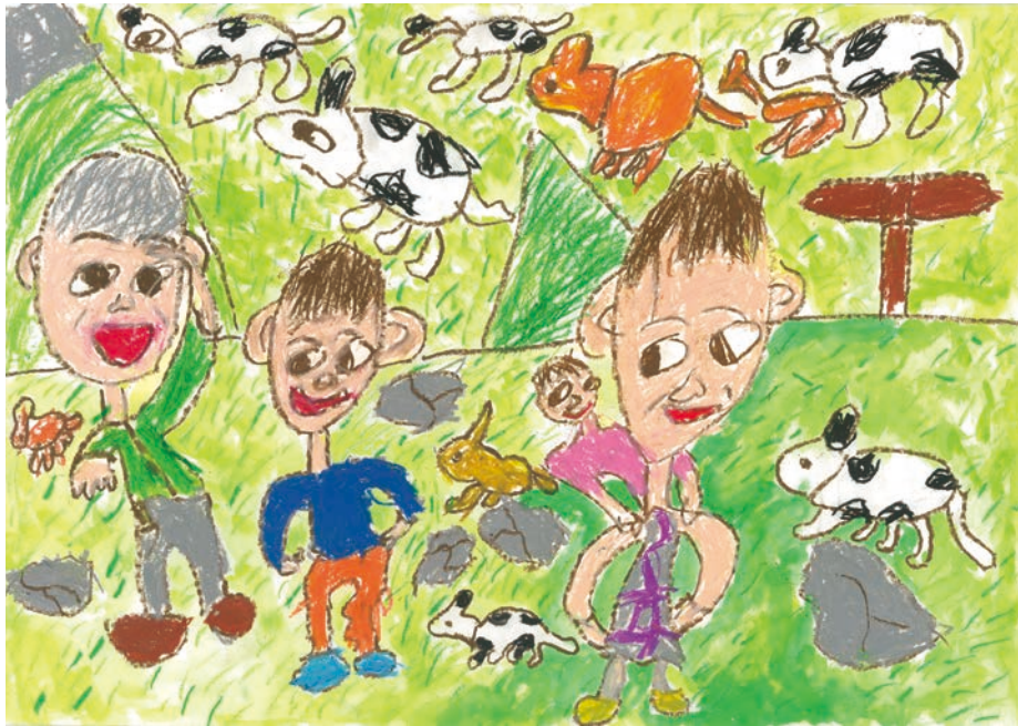
おじいちゃんおばあちゃんと四国カルストに行ったよ