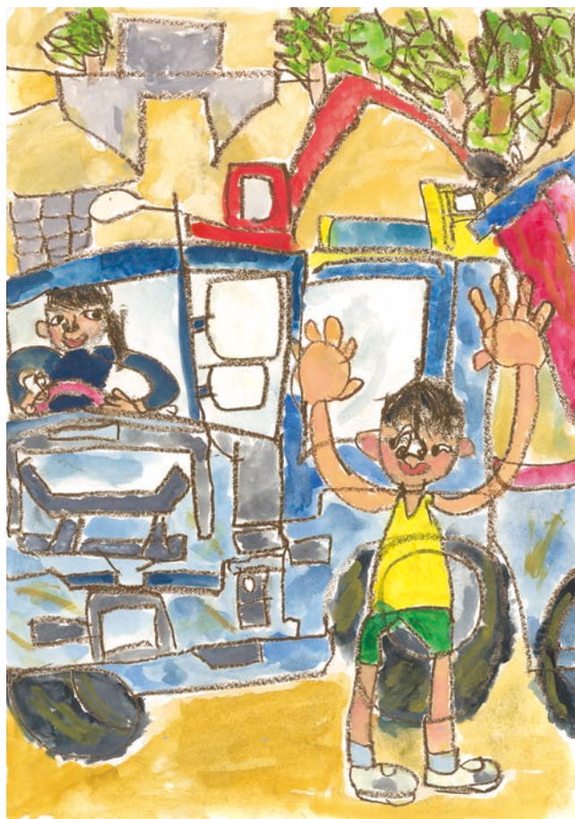
ダンプをうんでんするかっこいいばあば 柏小二年 池田蓮叶