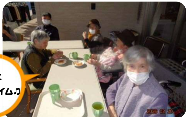
外で皆と ティータイム♪